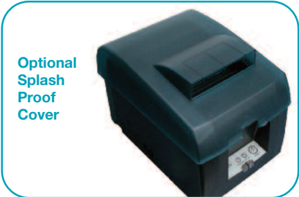
Optional Splash Proof Cover