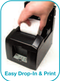
Easy Drop-In & Print