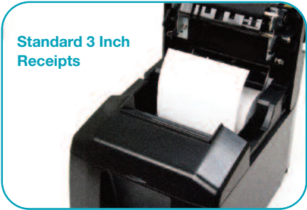
Standard 3 Inch Receipts