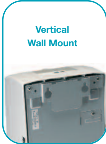
Vertical Wall Mount