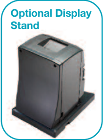
Optional Display Stand