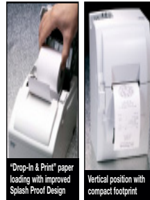
"Drop-In & Print" paper loading with improved Splash Proof Design

All available in Star White or Charcoal Grey with Serial / Parallel / USB (WHQL certified) or no Interface