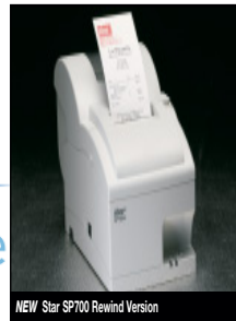
NEW Star SP700 Rewind Version