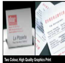
Two Colour High Quality Graphics Print