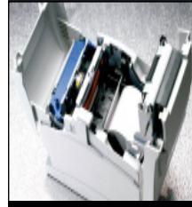
Easy maintenance and use