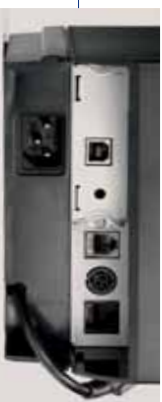
Exchangeable interfaces plus RJ-45 port