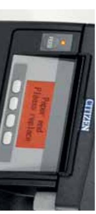
Error message with instruction