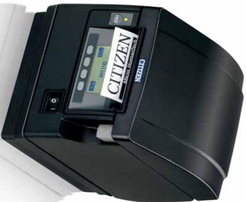
CT-S851 (available in black or white)