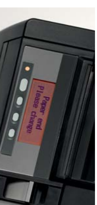
Error message with instruction