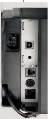
Exchangeable interfaces plus RJ-45 port

1) Model type CT-S801 2) Power supply DC: No power source S: Built-in power supply type A: AC adapter type 3) Paper width 3: 3 inch (80/83 mm) 2: 2 inch (58/60 mm) 4) Interface PA: Parallel RS: Serial RS-232C UB: USB only UH: USB with hub 5) Market: J: Japanese E: Europe/Asia U: North America C: China 6) Body case color WH: White BK: Black GR: Gray 7) PNE sensor No P: PNE sensor 8) Label No L: Label type 9) Black Mark sensor No M1: Left side M2: Right side