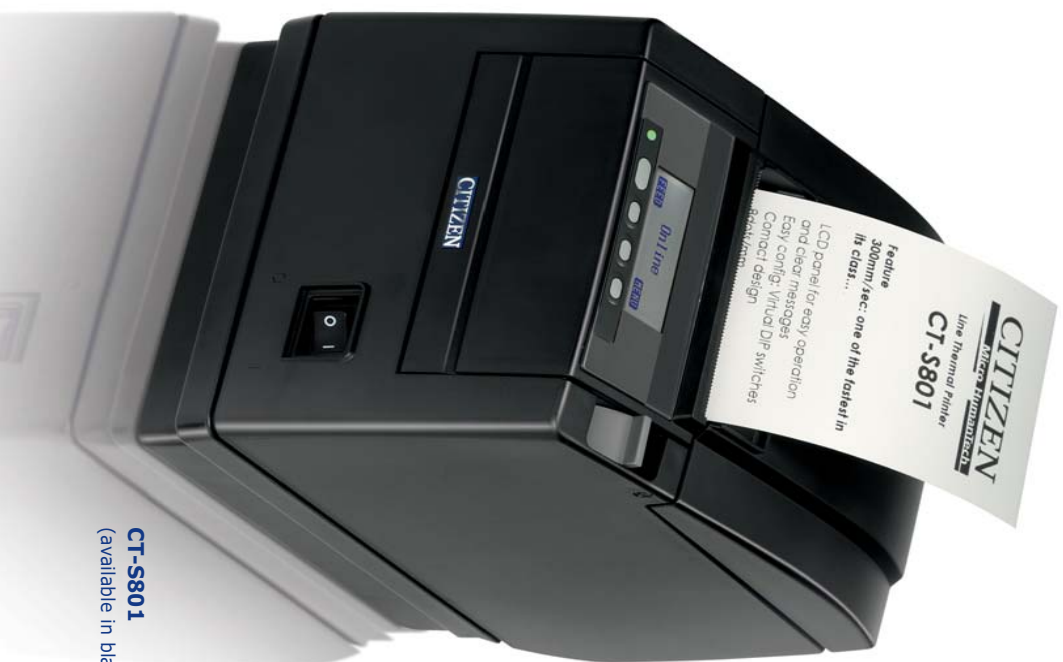
CT-S801 (available in black or white)