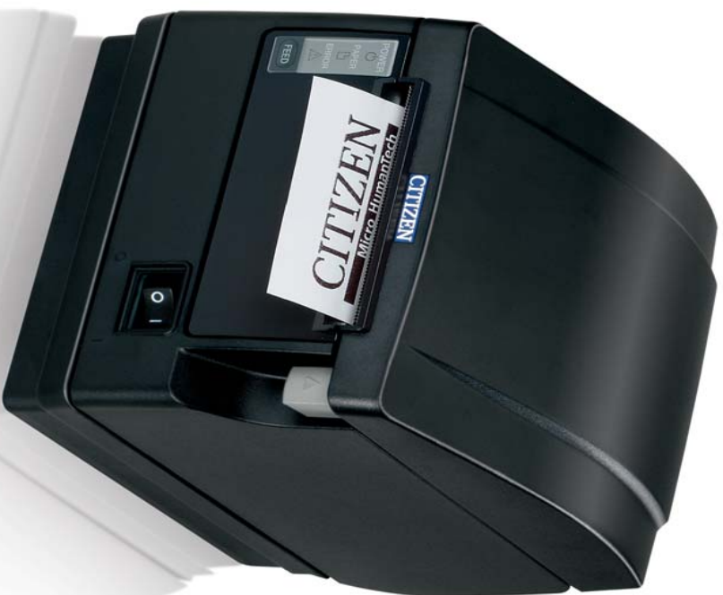
CT-S651 (available in black or white)