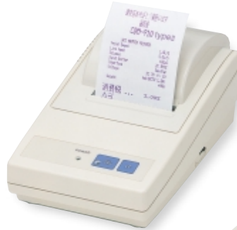
CBM-910 type II