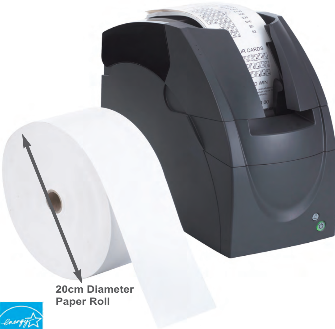
20cm Diameter Paper Roll

The World's "Best" Lottery Printer / Secure Transaction Printer with 100 Ticket Stacker